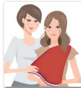
パーソナルカラー診断